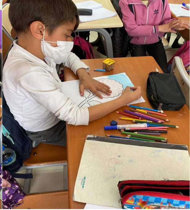
"Temiz Çevre Denilince Aklımıza Ne Geliyor Word Art" etkinliği yapıldı.