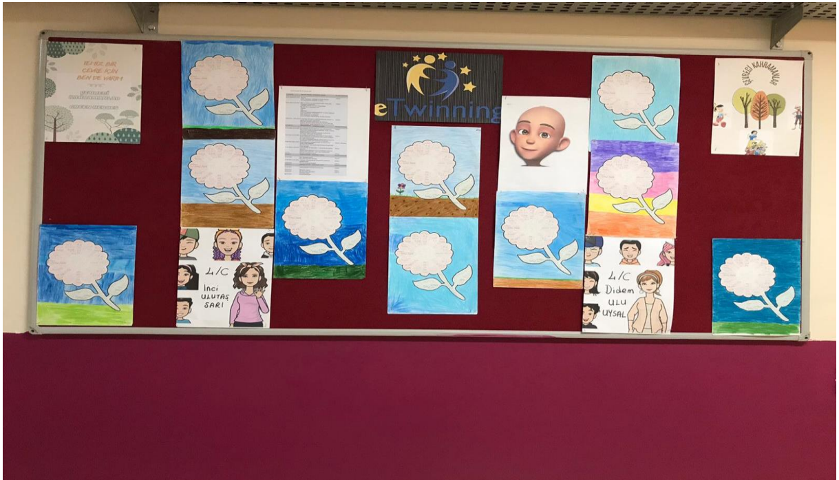
eTwinning panomuz hazırlandı.